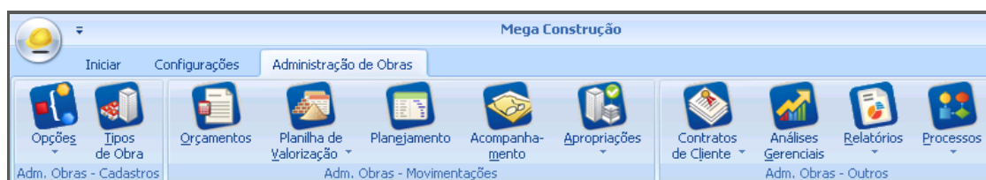
Administração de Obras